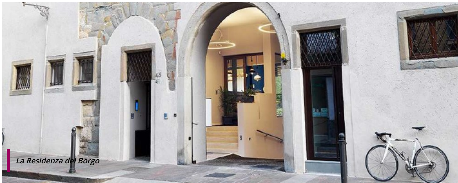
La Residenza del Borgo