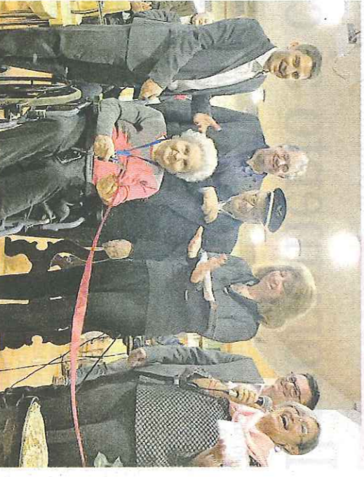
L'inaugurazione di un nuovo ambulatorio alla casa di riposo, alcuni mesi fa