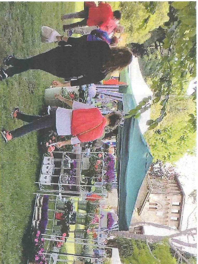
Il parco della biblioteca durante Floreka 2017. Dalla prossima estate si potrà accedere a internet dalle aree verdi del paese

«Si tratta di un progetto, per il quale è previsto un in-